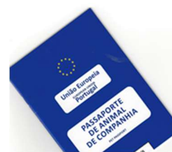
Figura 1 – Passaporte-UE.